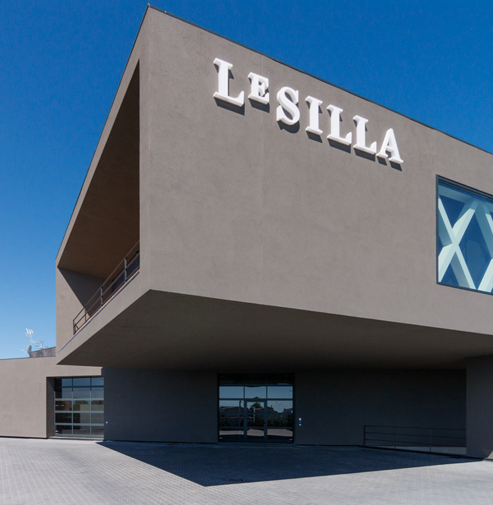
Sede di Porto Sant'Elpidio, Marche, Italia